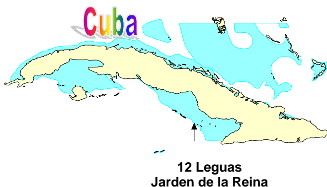
Figure 1. Ubicación geográfica del área estudiada.

nuestro equipo la embarcación Ferrocemento 116, de EPISUR, Santa Cruz del Sur, con su tripulación.